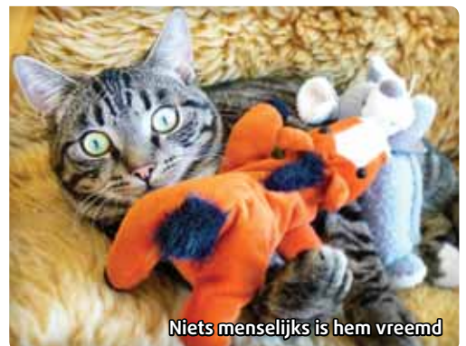
Niets menselijks is hem vreemd

Zo ziet u, niets dierlijks is ons vreemd.