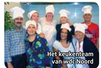
Het keukenteam van wdc Noord

en koffie. Wie maandag in De Plint wil meeëten, belt 301 1750, en wie in Noord op woensdag wil aanschuiven, belt 301 8784 (tussen 10.00-12.00 u).