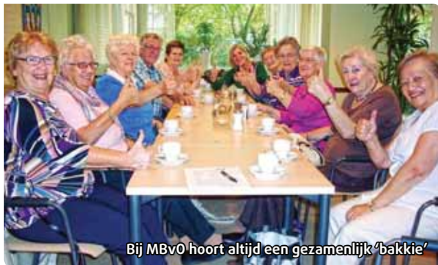
Bij MBvO hoort altijd een gezamenlijk 'bakkie'

In wijk- en dienstencentrum Noord is er nog plek bij de MBvO-gymles, op maandag van 14.45 tot 15.30 u. Info en inschrijven: tel. 320 9203.