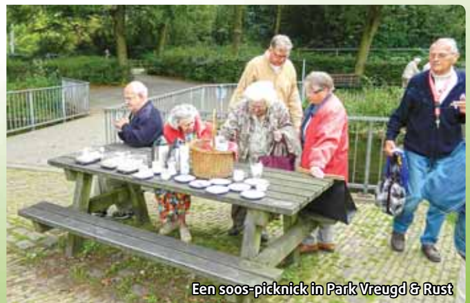
Een soos-picknick in Park Vreugd & Rust