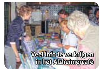
Veel info te verkrijgen in het Alzheimercafé

om kwijtraken van sleutels, maar ook om controleverlies over het eigen leven en het gevoel van het steeds verder wegraken van dierbaren.