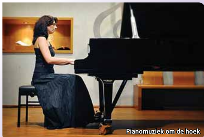
Pianomuziek om de hoek