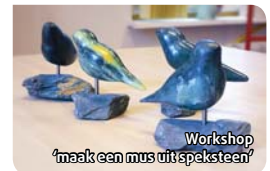
Workshop 'maak een mus uit speeksteen'

Ook dit jaar was er veel belangstelling voor de activiteiten. Op de feestelijke slotavond met live muziek gingen de voetjes van de vloer!