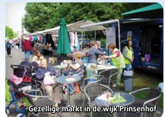
Gezellige markt in de wijk Prinsenhof.

Nieuwsgierig geworden? Kom gezellig langs. U bent van harte welkom.