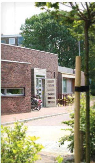
DE GROENE LOPER Van Royenstraat 2 2273 VD Voorburg Tel. 300 4747

4 nov. 9.00-12.00 u schoenenverkoop Fa. Tap. 2 dec. 9.00-12.00 u Anthony mode 26 dec. Woëj kerstdiner. 21 dec. 2011 t/m 1 jan. sluiting wdc Noord