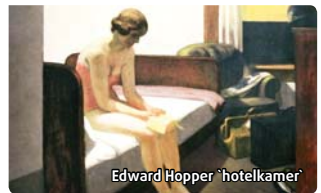
Edward Hopper 'hotelkamer'