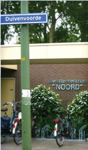
Noord Duivenvoorde 262 2262 AN Leidschendam Tel. 320 9203