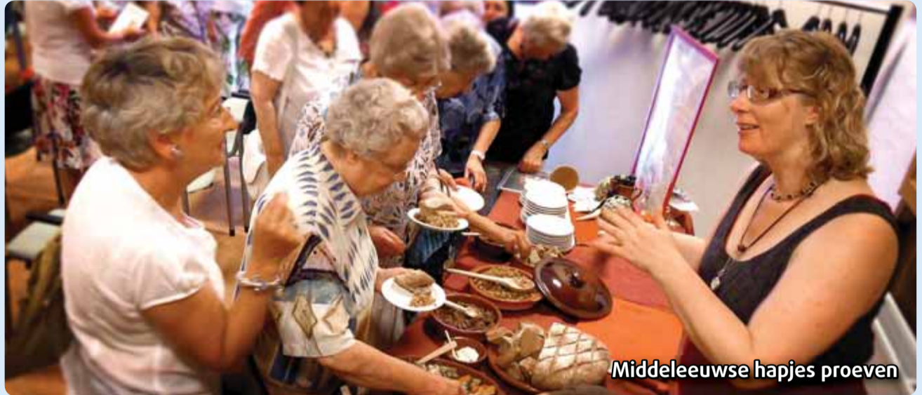
Middeleeuwse hapjes proeven

September, een voet in de herfst, maar toch vooral nagenieten van het mooie zomerweer. Heeft u ook zo genoten van de Zomertijdactiviteiten? Woej kon deze zomer veel ouderen verwelkomen tijdens het afwisselende Zomertijd-activiteitenprogramma. Zie ook p 7.