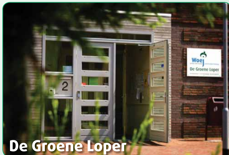
De Groene Loper

Wijk- en dienstencentrum De Groene Loper Van Royenstraat 2 2273 VD Voorburg Tel. 300 4747