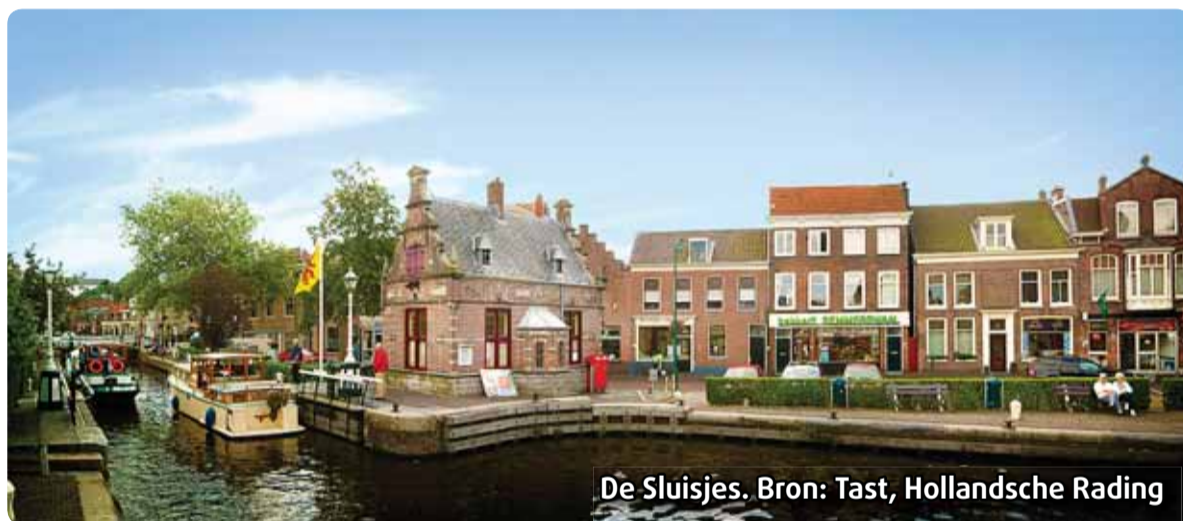
De Sluisjes.

Leidschendam-Voorburg is rijk aan monumenten. Een groot aantal panden in de gemeente herinnert aan het verleden. Leidschendam, Voorburg en Stompwijk kennen nu 88 rijksmonumenten en zo'n 400 gemeentelijke monumenten. Op zaterdag 11 september vond onder het thema De smaak van de 19e eeuw in de gemeente de Open Monumentendag plaats. Het publiek werd uitgenodigd om een kijkje te nemen in het rijke verleden van de panden. De opengestelde monumenten waren het toneel van culturele activiteiten, zoals tentoonstellingen, concerten en rondleidingen. Er werd langs monumenten gewandeld, gefietst, gevaren én gereden. Meer informatie via www.omd-lv.nl