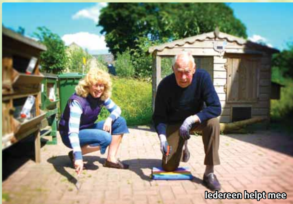
Iedereen helpt mee

Mensen die thuis niet meer zo'n zin hebben in de kant en klaar maaltijd, eten meer. Je staat hier samen te koken, het ruikt lekker. Zo bieden we zorg in de breedste zin van het woord: geestelijk, lichamelijk en sociaal.