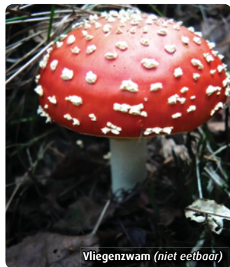
Vliegenzwam (niet eetbaar)

Wij hebben het in vergelijking met de dieren maar gemakkelijk: wij trekken warme kleding aan, wij hebben voldoende te eten en ons huis is verwarmd. Trek er eens lekker op uit in de herfst of de winter, als de zon schijnt of als het waait. Vergeet de wintervogels niet en maak vooral uw tuin niet te netjes: denk aan de overwinteraars!