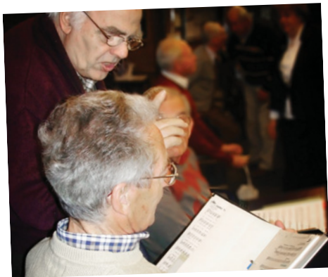
Een onderonsje vooraf