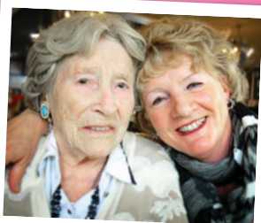
Moeder en dochter

Eiland Mallorca Brengh ons geluk. In onze club!