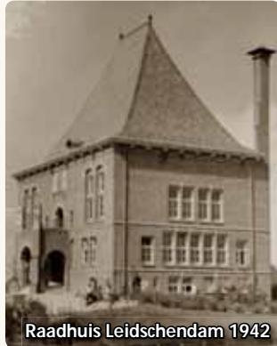
Raadhuis Leidschendam 1942