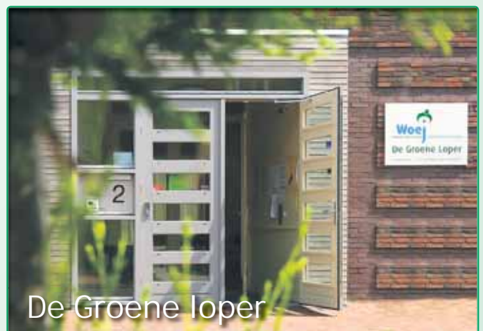
De Groene loper