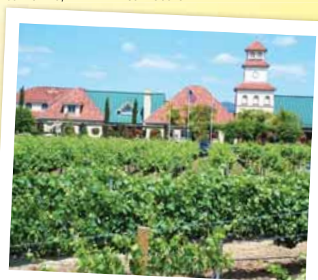
Wijngaarde in Temecula, CA