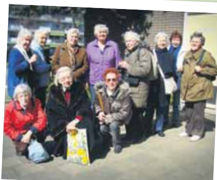
De wandelaars van april

een programma. Ze bereidt elke wandeling goed voor, en zoekt van alles op over wat u onderweg tegenkomt. Over veel planten, bomen, buurten heeft ze wel een verhaal paraat. Ook weet ze de wandelaars vaak te verrassen met een toepasselijke legende. Wordt u al nieuwsgierig? Wandel mee!