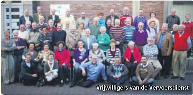
Vrijwilligers van de Vervoersdienst

Het project Vervoersdienst voor ouderen, uitgevoerd door vrijwilligers, bestaat 25 jaar. Dit is met een feestavond voor alle vrijwilligers gevierd op 14 april in De Groene Loper in Voorburg.