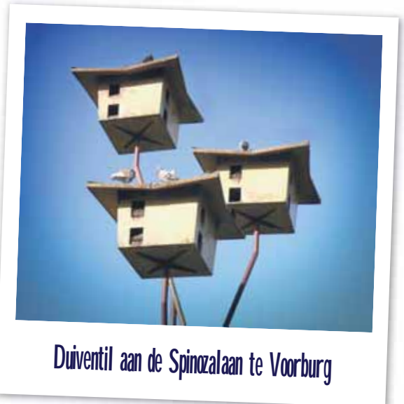
Duiventil aan de Spinozalaan te Voorburg

Let maar op, de zomervakantie staat voor de deur.