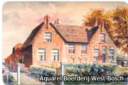
Aquarel Boerderij West-Bosch

Deze opmerkelijke 17 e eeuwse boerderij ligt aan de oude Voorweg (huidige Koningin Julianaweg 116-120) van Veur, waar in de 16 e en 17 e eeuw boerderijen zijn gebouwd. West-Bosch is afgebeeld op onderstaand aquarel van J. Verheul uit 1927. De noordzijde van den 'Leydsen-Dam' werd vroeger Veur genoemd. Deze aquarel is gemaakt in de tijd dat op de hepalen van