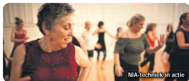
NIA-techniek in actie

Heeft u interesse in één van bovengenoemde lessen, dan kunt u contact opnemen met wijk- en dienstencentrum De Groene Loper, tel. 300 4747 (maandag t/m vrijdag van 09.00-17.00 uur). Het adres is Van Royenstraat 2, 2273 VD Voorburg. Voor al deze cursussen geldt, dat ze alleen doorgang vinden bij voldoende aanmeldingen.