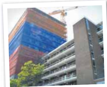
Er wordt nog druk gebouwd

De woningen zijn zo toegankelijk mogelijk gemaakt voor ouderen en gehandicapten: geen drempels, brede deuren en brede balkons. De galerij en balkons zijn opgehoogd zodat er geen afstapjes zijn. Uitgangspunt binnen alle appartementen is dat er toegang is van de hoofdslaapkamer naar de