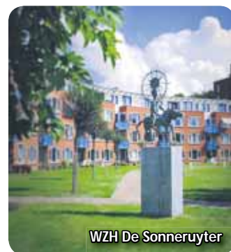
WZH De Sonneruyter

Een verpleeghuis richt zich op (intensieve) verpleging, behandeling en begeleiding die mensen thuis of in het verzorgingshuis niet kunnen ontvangen. In verpleeghuizen zijn somatische afdelingen voor bewoners met lichamelijke beperkingen en psychogeriatrische afdelingen voor bewoners met de ziekte van Alzheimer of een andere vorm van dementie. In het verpleeghuis kunt u ook revalideren, na bijvoorbeeld een heupoperatie of een herseninfarct, om daarna weer thuis te kunnen wonen.