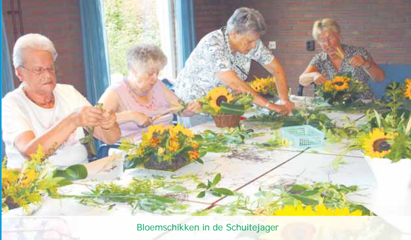
Bloemschikken in de Schuutejager